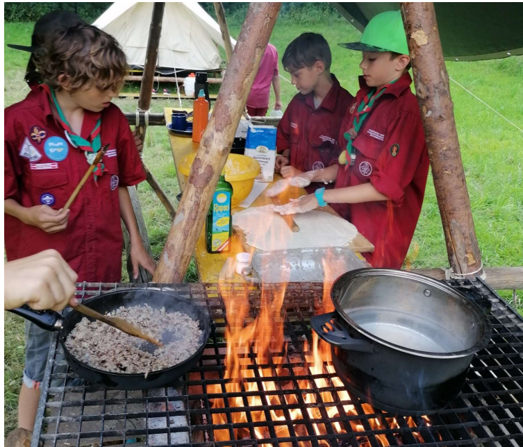
- So kochen die Kinder die ganze Woche auf dem Feuer